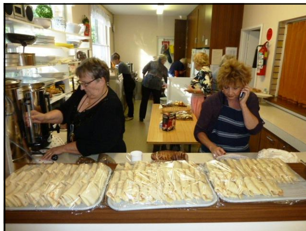
Vai kāds vēlās pankūkas?