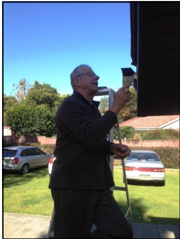
Ivars veic remontus.